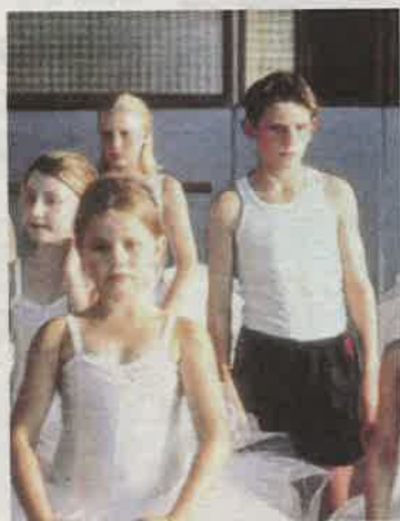
« Billy Elliot », « Penguin highway » et « Wardi » font partie des films à ne pas rater cette semaine au cinéma Jean-Eustache.