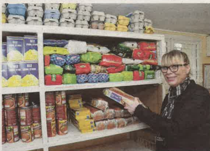
Réapprovisionnement de la partie épicerie

« On les suit, on essaie de les motiver pour qu'elles repartent avec un nouvel élan. Évidemment, pour les personnes âgées, c'est différent, car leur situation a peu de chances