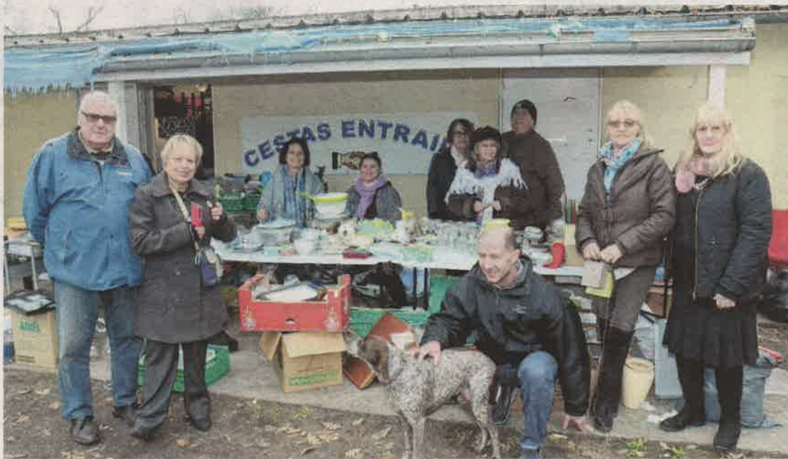
Quelques bénévoles au local de Gazinet.

Cestas entraide redistribue ces biens à ses ayants droit, « essentiellement des gens qui nous sont envoyés par le CCAS de Cestas et une assistante sociale après constitution d'un dossier », précise Jean-Philippe Nadeau. « Ce sont des personnes âgées, des chômeurs et beaucoup de femmes seules avec enfants. » Ceux-là ne paient pas. En revanche, les vide-greniers qui ont lieu tous les lundis et mercredis (10 à 12 heures ; 14 heures à 17 h 30) derrière la chapelle de Gazinet, sont également ouverts au public qui, lui, achète à petits prix, le plus souvent entre 1 et 5 euros, sauf pour de gros objets comme l'électroménager et les meubles. C'est aussi le moment où l'association reçoit les dons de vêtements et autres articles.